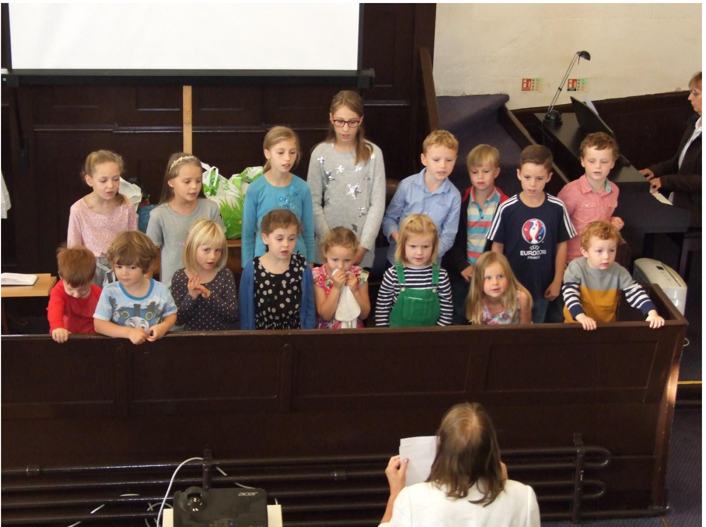
Sul Diolchgarwch y Plant – Y cast llawn! (rhagor o luniau'r unigolion ar dudalen 5)