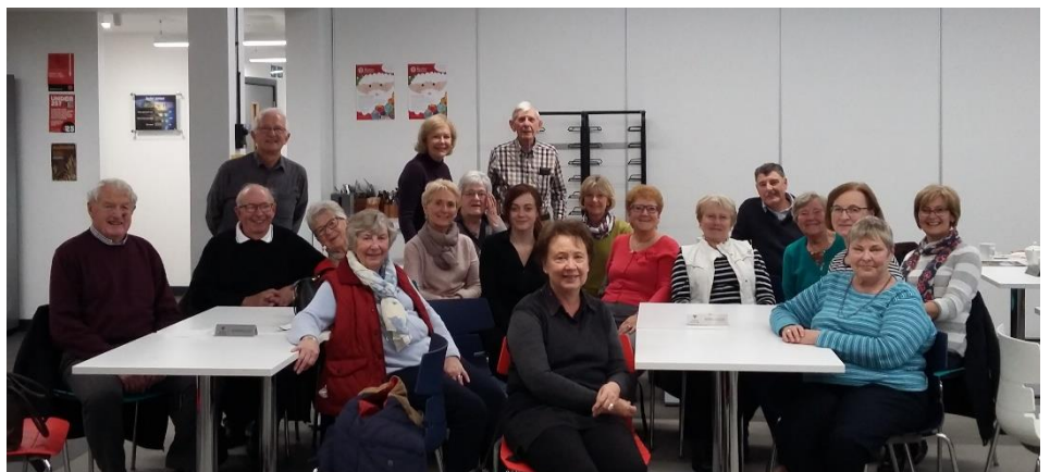
Ymweliad aelodau'r Cwrdd Merched â'r Bathdy yn Llantrisant. Uchod, gwelwch y fintai fu draw yn cael "Y Profiad" (sydd wedi ei hysbysebu ar sawl cylchfan yn yr ardal). Yma mae'r darnau punt crwn olaf yn cael eu bathu – a bydd darn punt newydd ac iddo 12 ochr yn cael ei gynhyrchu'r flwyddyn nesaf. Cawn hanes llawn am weithgareddau'r Cwrdd Merched yn ein rhifyn nesaf.